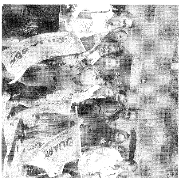
Arrancan obras viales